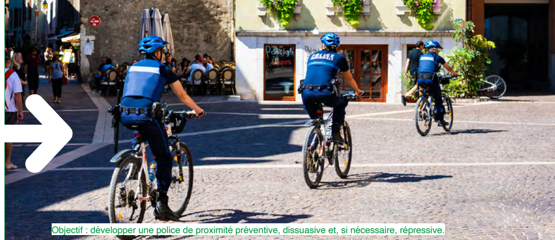
Objectif : développer une police de proximité préventive, dissuasive et, si nécessaire, répressive.