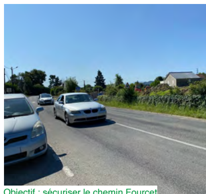
Objectif : sécuriser le chemin Fourcet